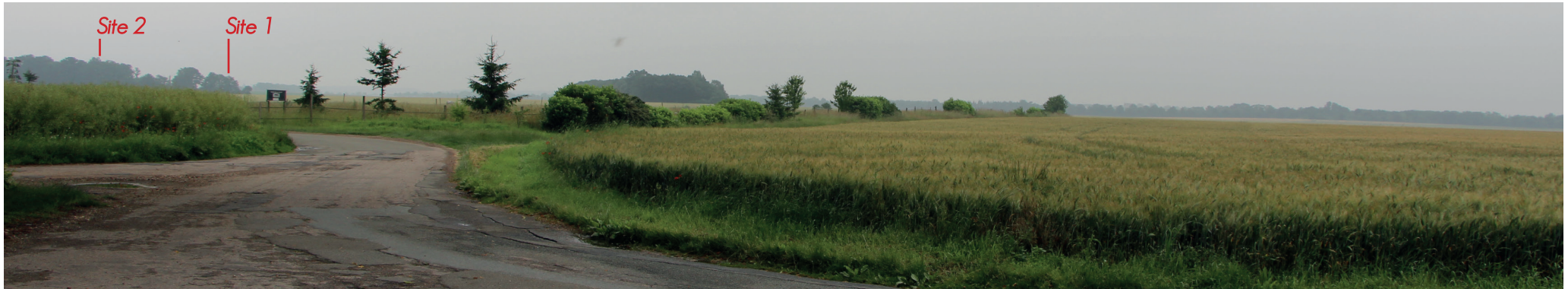
Vue 16 - Vue depuis la sortie de Saint-Martin-de-Nigelles sur la D101.5. La topographie et les boisements rendent les sites imperceptibles depuis cette voie et même depuis Saint-Martin-de-Nigelles. L'enjeu de visibilité est nul.