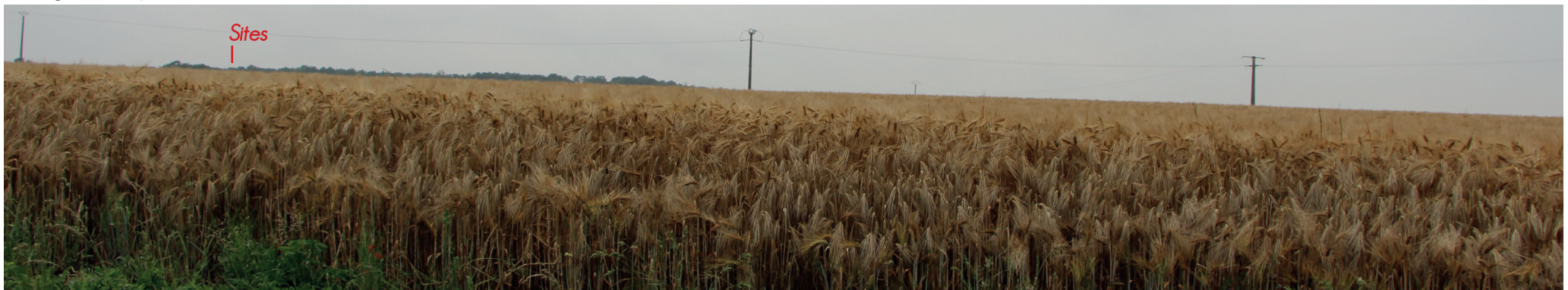
Vue 17 - Vue depuis les hauteurs de Houx au Sud des sites. La topographie rend les sites impossibles à voir depuis le sud de la crête. La carte de visibilité peut être revue en tenant compte des boisements et de la topographie ressentie sur place (la précision du MNT ne permet pas un certain niveau de détail) en excluant les vues depuis le sud vis-à-vis des sites.