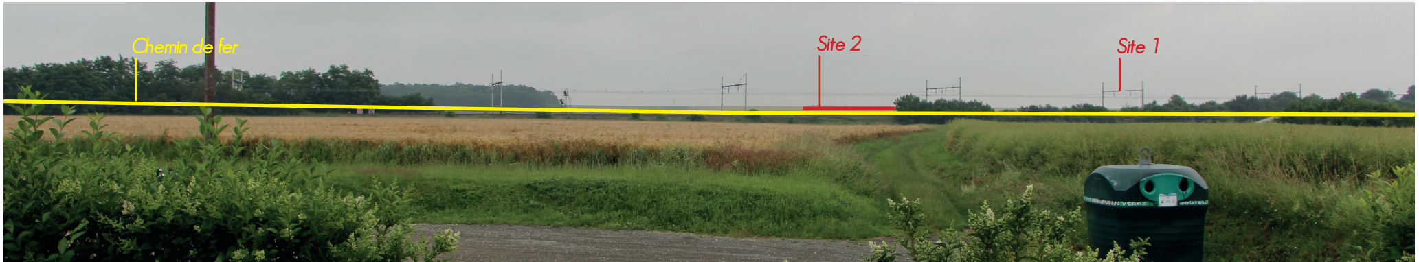
Vue 15 - Vue depuis l'église et le cimetière de Hanches vers les sites d'étude. Le cordon boisé qui accompagne la voie ferrée cache le site 1, cependant ce cordon est interrompu sur une courte section qui laisse apparaître le site 2. Ce point constitue un enjeu majeur pour ce projet.